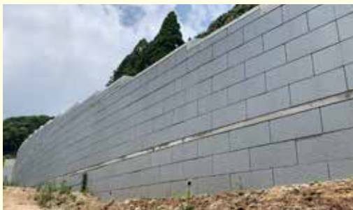
多数アンカー式補強土壁工法（診断対応型NDパネル組込み） EDO- EPS工法