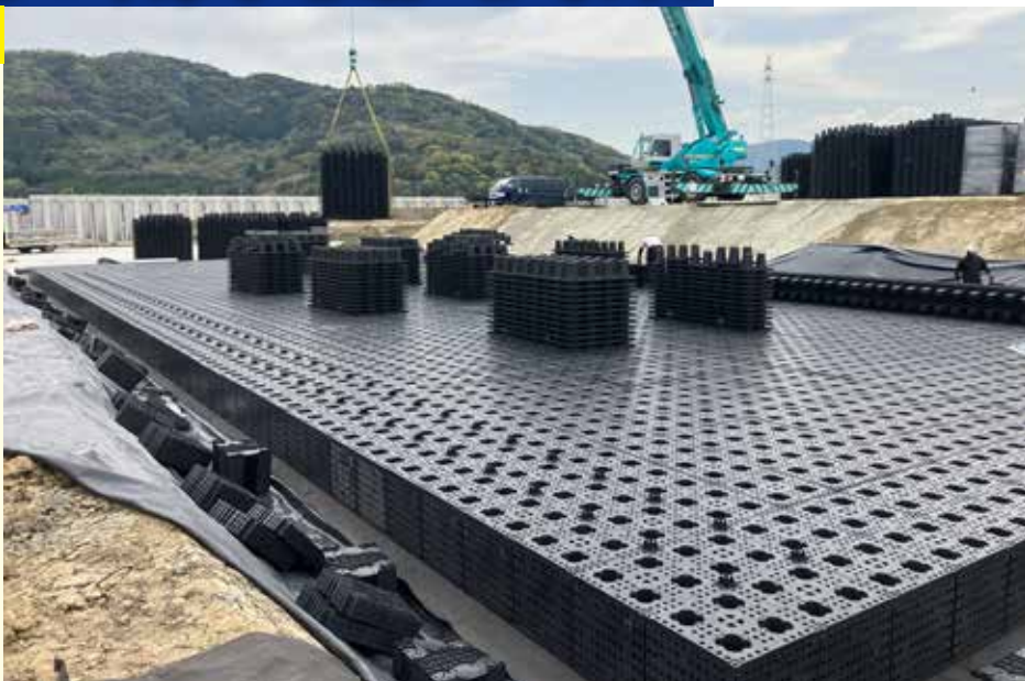
水槽施工完了状況

この施設において、雨水流入の対策として貯留槽に採用されているのが「ジオプールAE-1」。ジオプールAE-1は再生プラスチックを材料にしながら最大土被り3.3mの高い耐荷重性能を持ち、埋戻し後の施工中