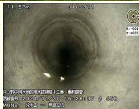
水路へのカメラロボット投入による事前調査も行われた