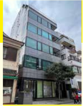
岡三シビル本社(東京都品川区: アドバンス上地ビル) TEL: 03-6433-9601

そしてこの度、社会を後ろから支える岡三リビング(LIVIC=CIVILの逆読み)と対になる存在として表から公共ニーズを担うべく、岡三シビルと社名を変更して新たなスタートを切る事となりました。岡三シビルは岡三リビングと手を携えながら、工事に対する責任と安心感で応えてまいります。