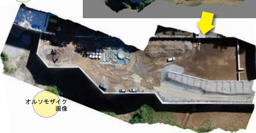
オルソモザイク 画像